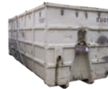
40 m 3 Abrollcontainer