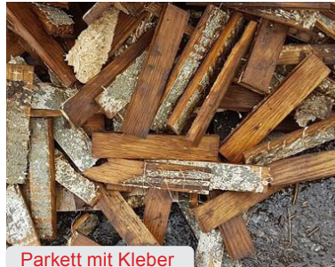
Parkett mit Kleber