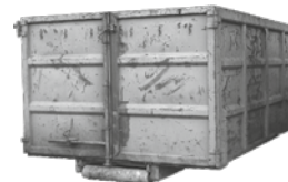
25-30 m 3 Abrollcontainer