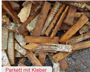
Parkett mit Kleber