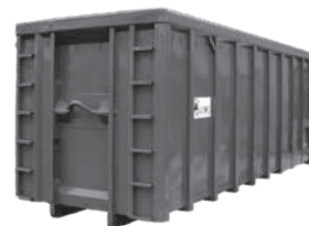
30-40 m 3 Abrollcontainer