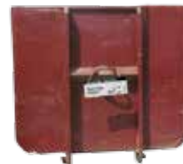
30 m 3 Muldencontainer